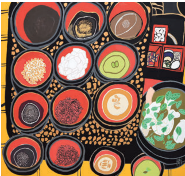
「もち膳」65×65 南 俊一郎