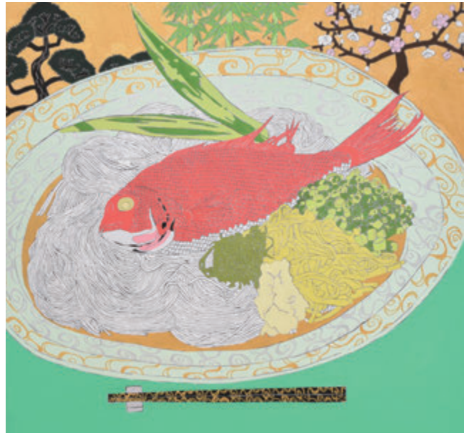
「鯛そうめん」53×53 加藤 丈博