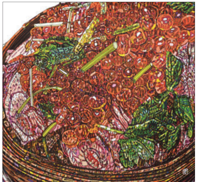
「わっぱ飯」50×66 森田 守