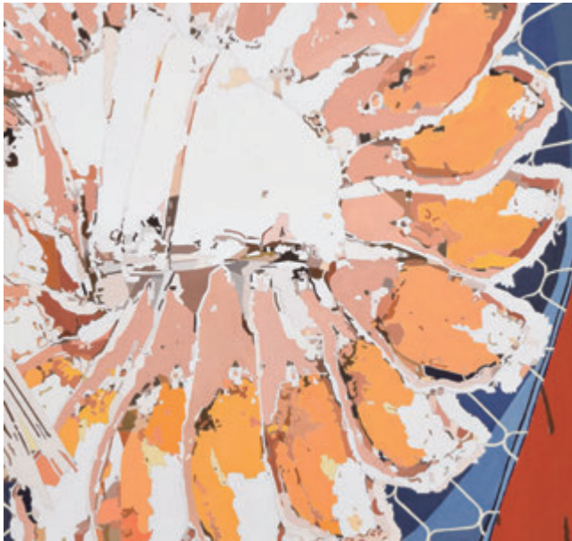
「鮎寿司」66×50 岩本 悠介